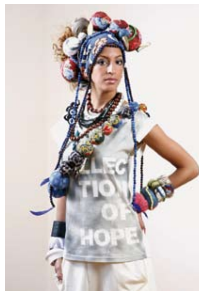
ESMOD, Collection of hope