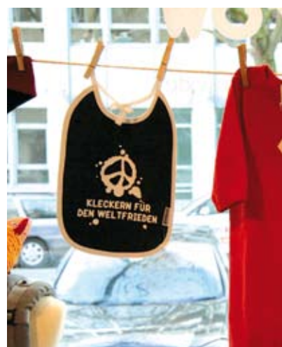
hug and grow