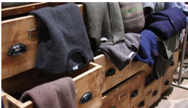
BREAD & BUTTER

„Viele junge Designer teilen heute die Visionen und Ideen ihrer avantgardistischen Vordenker der Eco-Bewegung. Gerade für die jungen Wilden sind funktionierende und kompetente Netzwerke überlebenswichtig. Plattformen wie THEKEY.TO oder CREATE BERLIN geben der Design- und Modeszene einen angemessenen und einzigartigen, somit wahrnehmbaren Rahmen.“