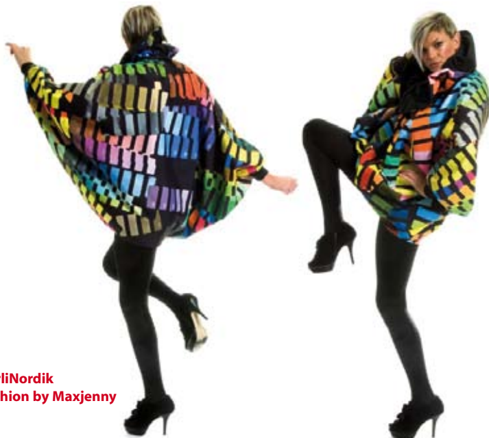
BerliNordik Fashion by Maxjenny

Mit der Erkenntnis, dass eine gemeinsam getragene Initiative die Effekte multipliziert, werden aktuell Energien und Ressourcen stärker denn je gebündelt.